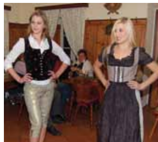
Präsentation Bärenjilet im GH Lausegger