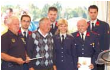
Oktoberfest der FF-St.Johann