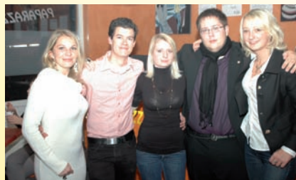
JVP Ferlach aktiv - Die Indian-Summer Party mit Body Painting Blickfang.