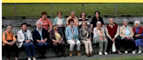
Die Ferlacher Senioren, gut gelaunt beim Ausflug nach Frögg.