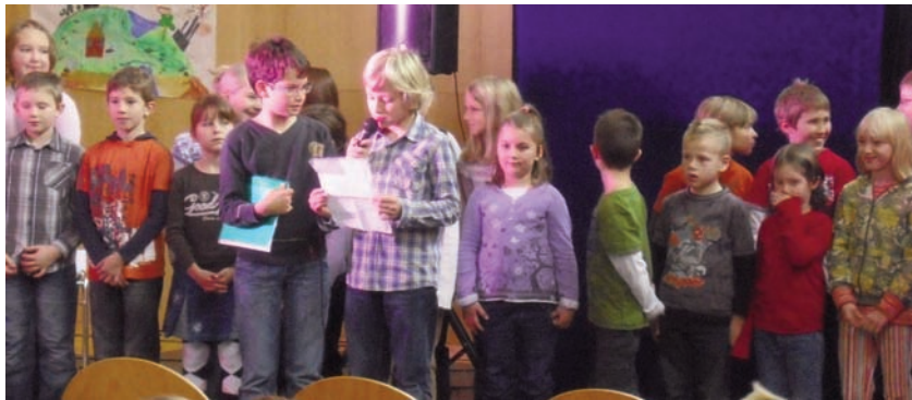
Tüchtige Klimameilensammler der Volksschule Ottmanach