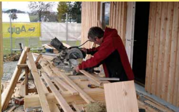
Außenfassade des TC Vereinshauses aus unbehandelter Lärche. Isolieren und brettern in Eigenleistung.

Mit Unterstützung der Gemeinde und des Landes Kärnten konnte das Vereinshaus für den Preitenegger Tennisclub errichtet werden. Es fehlt noch der Innenausbau wo die Mitglieder des Vereins auch selber Hand anlegen werden, wie schon bei der Montage der Fassade. 10% bis maximal 15% der Bausumme dürfen als Eigenleistung eingebracht werden, mehr nicht da sonst der Verdacht auf Schwarzarbeit bestehen würde. Die in Eigenleistung erbrachten Stunden werden angerechnet und fließen wieder in den Bau ein. Integriert in das Gebäude sind Toiletten für den Festplatz. Die beiden Festplatz Container kommen zum Abfallwirtschaftshof wo sie für die Aufbewahrung von Sondermüll adaptiert werden. Der Tennisclub plant eine Einweihungsfeier im Sommer 2011.