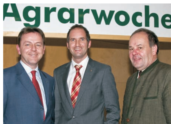
Minister Berlakovich, Woltsche, Heritzer (von links)

Weil Stadt und Land nur gemeinsam stark sind, setzen wir uns mit ganzer Kraft für den ländlichen Raum ein. Wir stehen für den Ausbau der Infrastruktur in ländlichen Gebieten, für die Ortsgestaltung, die Verbesserung des Wegenetzes und weitere Maßnahmen, die der Landbevölkerung neue Ausblicke eröffnen.